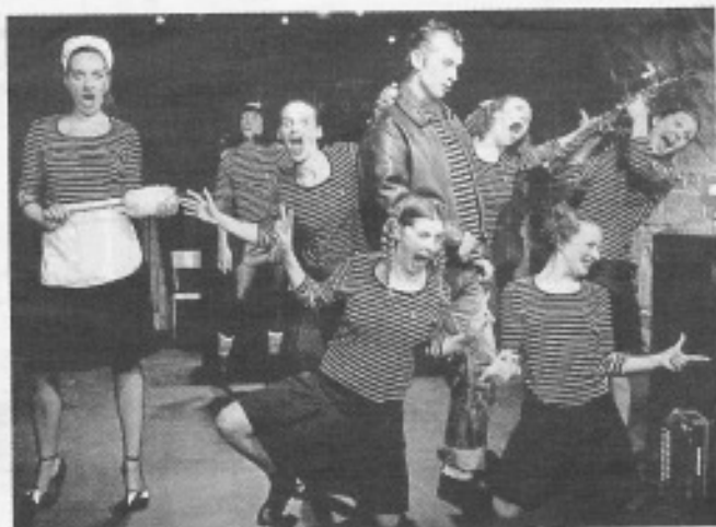
Des comédiens dynamiques et pleins d'humour.

Krafft qui tra- n partenariat grand T, ac- credi 15 mai à omédie fram- n spectacle de cal humoristi- nzaine de co- nleux et pleins ourne sur les vraie-fausse etrouver l'irrè- mour de Bobby est un hommage ique, plein de bre auteur de de contrepètes s avanies, par te qui connaît r cœur. Cette es chahuteurs danse et revi-